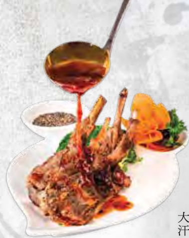
大汗孜然羊扒 四件